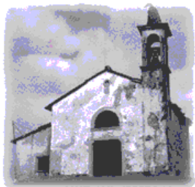
Chiesa di San Bartolomeo

⇒ Da Sant'Andrea: mulattiera Val Tanara – Carradori San Bortolo – Aldegheri base scout;